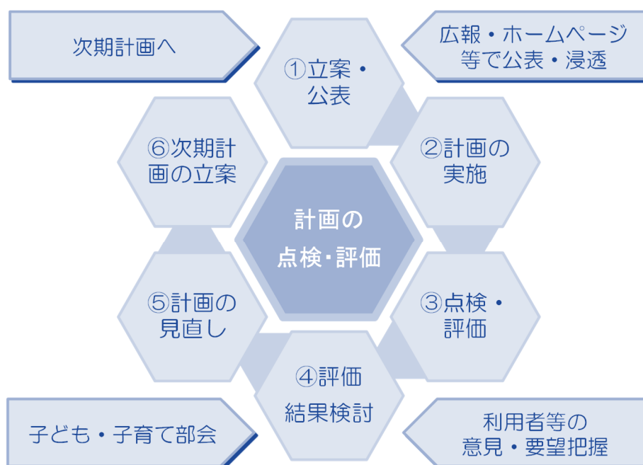
計画の達成状況の点検・評価におけるサイクル

また、実施事業や様々な活動の現場、家庭への訪問機会や保護者の事業利用・来訪などあらゆる場面を通じての意見・要望把握に努め、利用者の立場に立った施策・事業の推進を図ります。