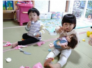
また支援センターに遊びに来てね