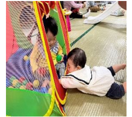
園庭や室内での自由遊びを楽しみました