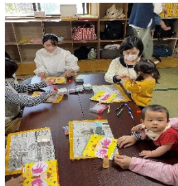
親子製作(手形でちょうちょ製作)